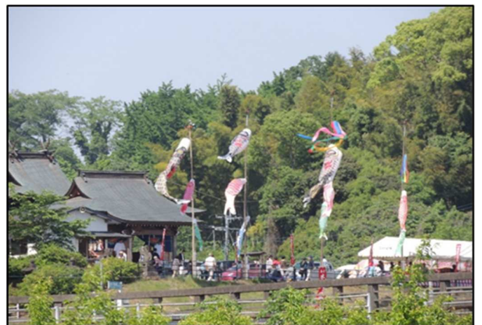
《山下水天宮大祭：5月4日5日》