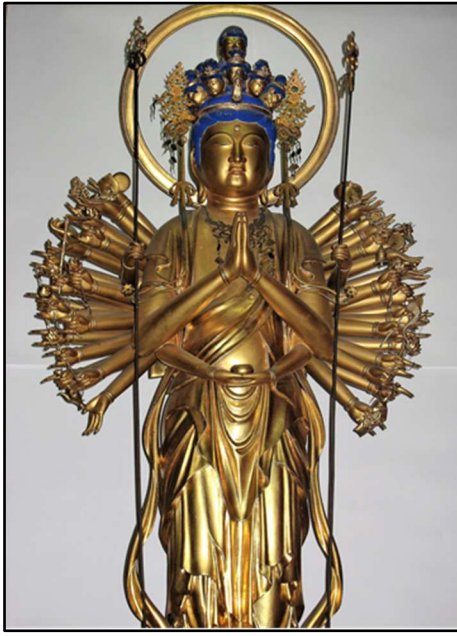
《大光寺十一面観世音菩薩》