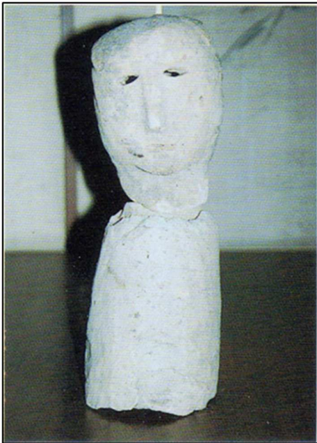
《茶臼塚古墳出土の人物埴輪》