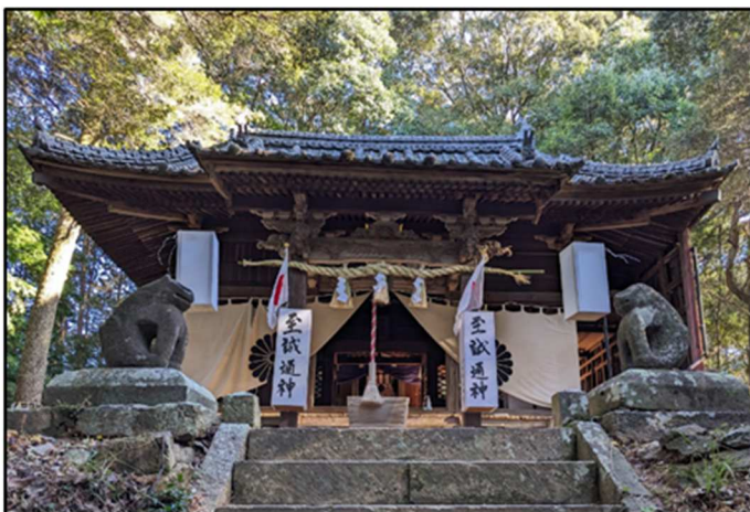
《六所宮拝殿：令和6年正月》