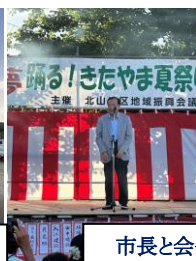
市長と会長の挨拶