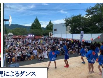
筑南小3年生の熱演