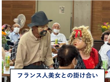
フランス人美女との掛け合い