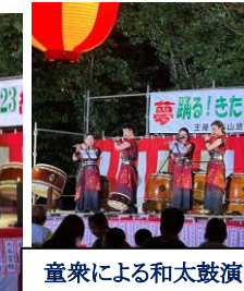
童衆による和太鼓演