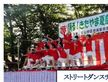
ストリートダンスチームのダンスと八女農高総合音楽部の演奏