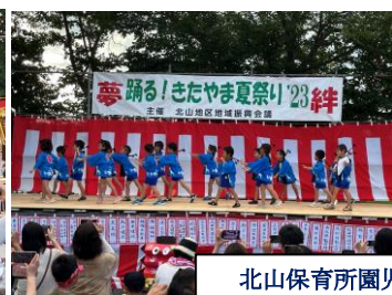
北山保育所園児によるダンス