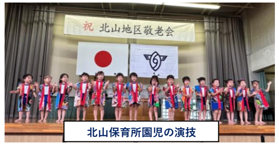
北山保育所園児の演技