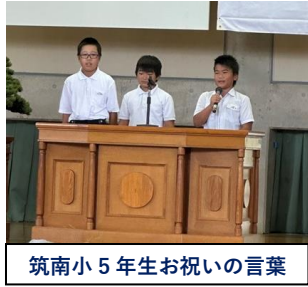
筑南小5年生お祝いの言葉