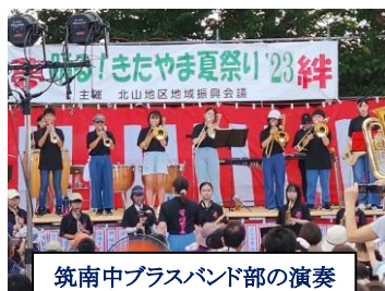
筑南中プラスバンド部の演奏